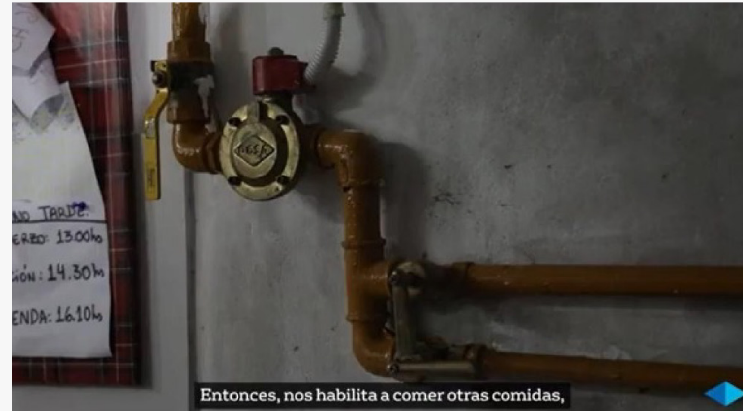
Entonces, nos habilita a comer otras comidas,