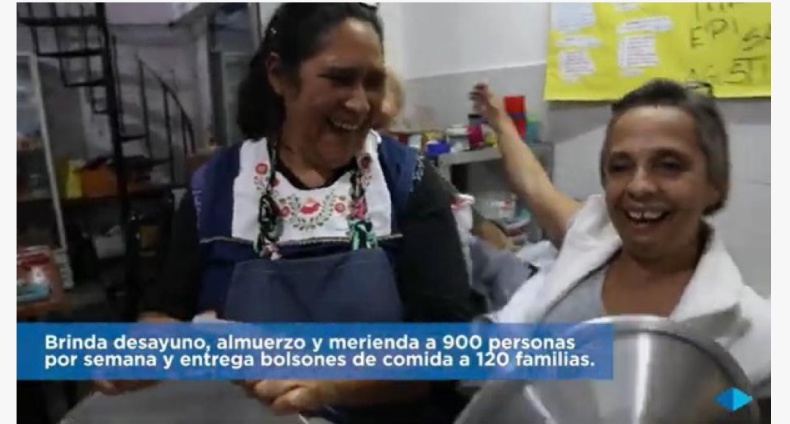
Brinda desayuno, almuerzo y merienda a 900 personas por semana y entrega bolsones de comida a 120 familias.