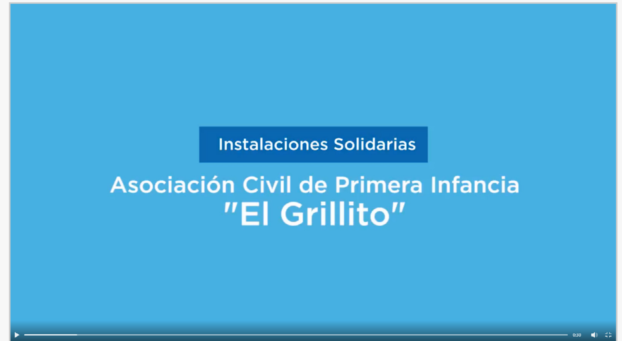
Comedor "El Grillito" (Video)